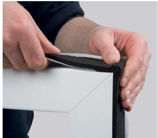
Monteringsseksempel: ISO-BLOCO ONE

*** Ved bevegelse i konstruksjons elementer og midlertidige endringer i lengderetningen skal hensyntas ved maks fuge bredde.